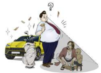
내가 그들을 박히지 해가 불렀고 그들이 내가 부른바 교만해졌다. 그래서 그들의 나를 잊어버렸다. 요사야16